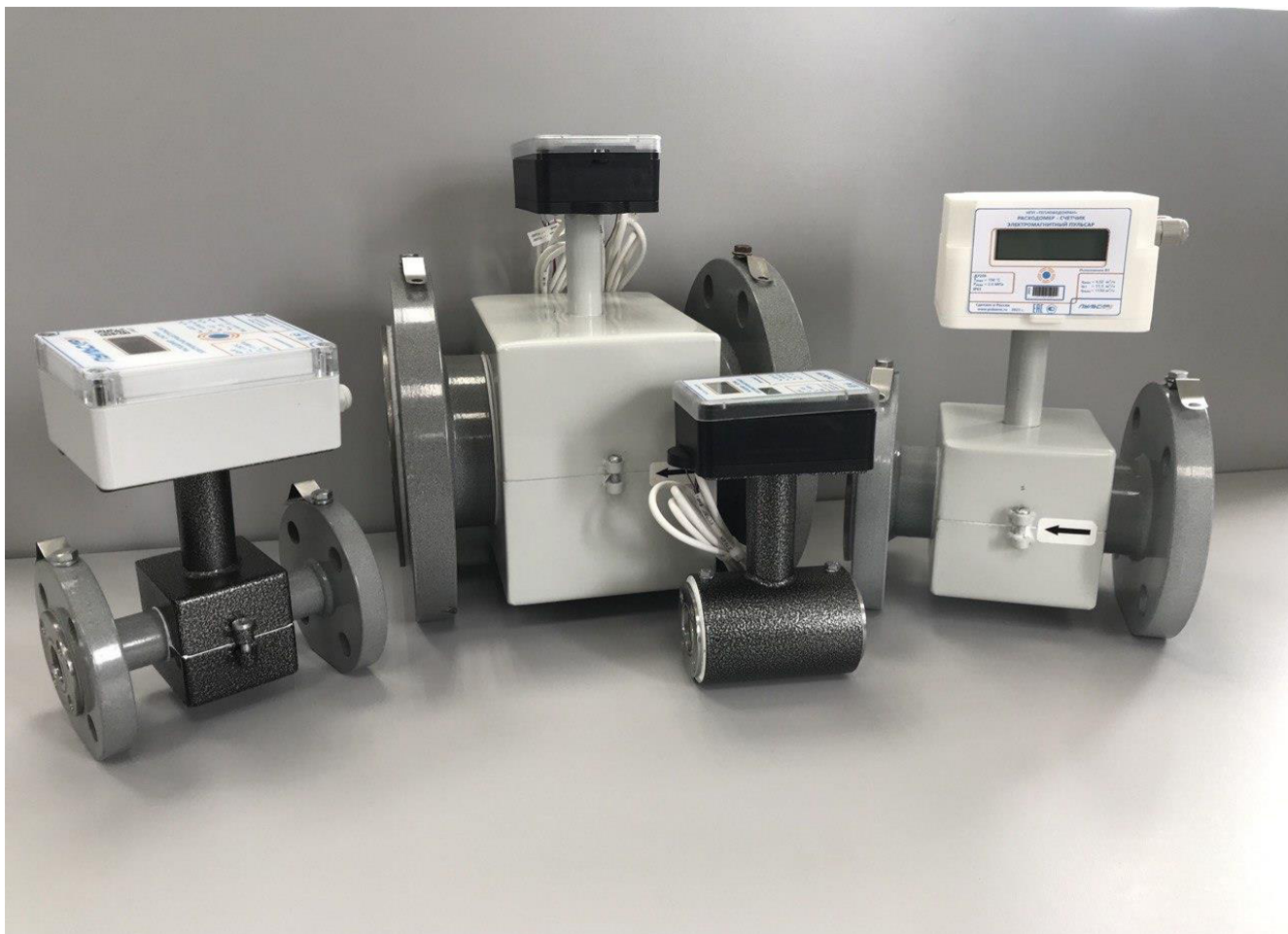
Рисунок 1 – Общий вид расходомеров-счетчиков электромагнитных ПУЛЬСАР

У расходомеров модели 1 используется одноразовая крышка, вскрытие которой невозможно без повреждения. Защита от несанкционированного доступа обеспечивается конструкцией вторичного измерительного преобразователя. Знак поверки на расходомеры модели 1 не наносится.