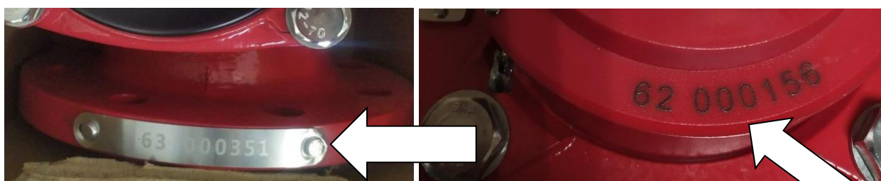
Рисунок 3 – Место нанесения заводского номера