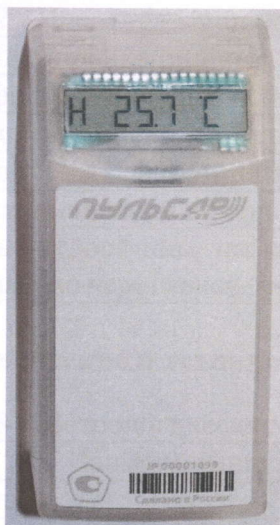
Рисунок 3 - Общий вид распределителя исполнений Пульсар 2-1(2)-Р(О, РО)