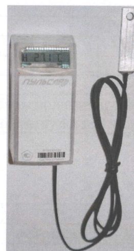
Рисунок 4 - Общий вид распределителя исполнений Пульсар 2-2в-Р(О, РО)