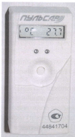
Рисунок 1 - Общий вид распределителя исполнений Пульсар 1-1-Р(О, РО)

Распределители пломбируются механической защелкой однократного применения, предназначенной для идентификации факта несанкционированного доступа. Демонтаж распределителя с отопительного прибора возможен только после разрушения пломбы, что фиксируется и кодируется в виде ошибки, которая выводится на дисплей. Схема пломбировки от несанкционированного доступа представлена на рисунке 5.