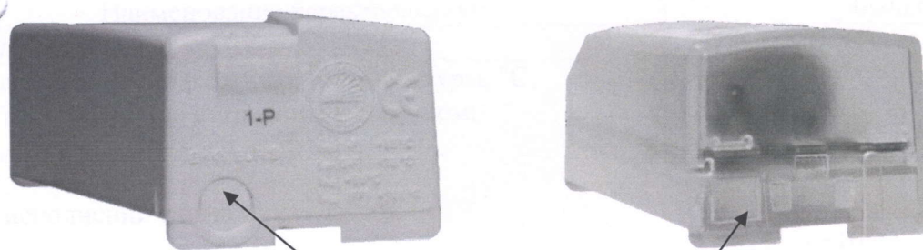
Пломба (механическая одноразовая защелка)