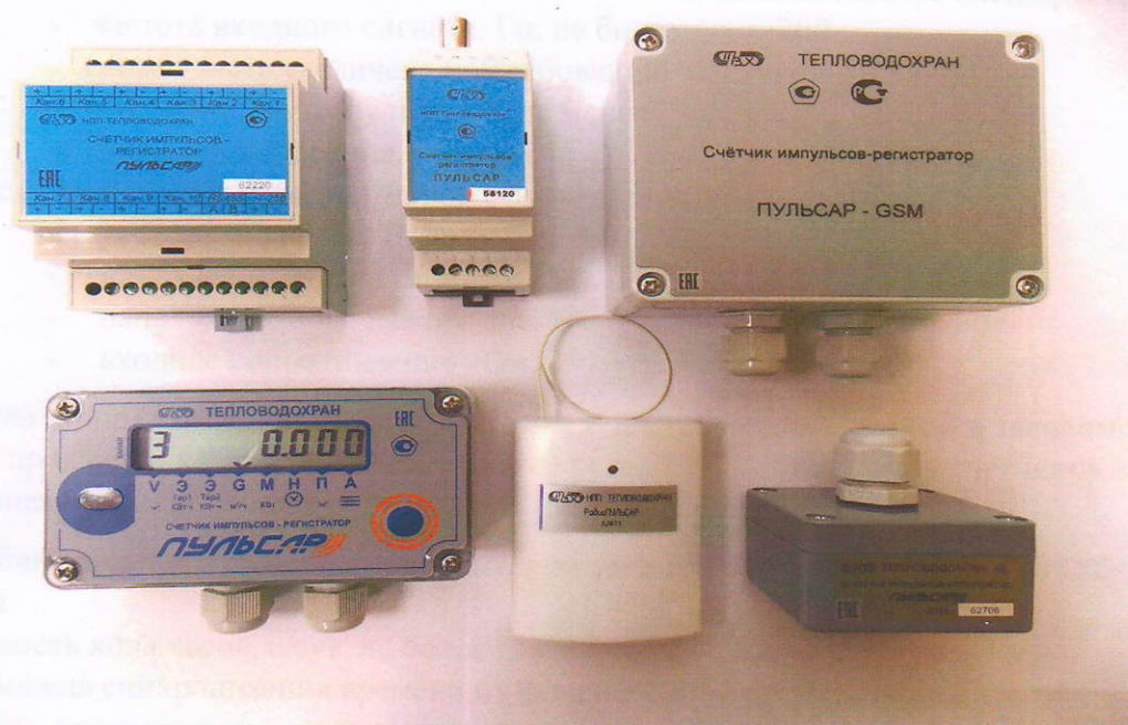
Рисунок 1 - Общий вид регистраторов различных исполнений

Фото общего вида регистраторов различных исполнений приведены на рис.1.